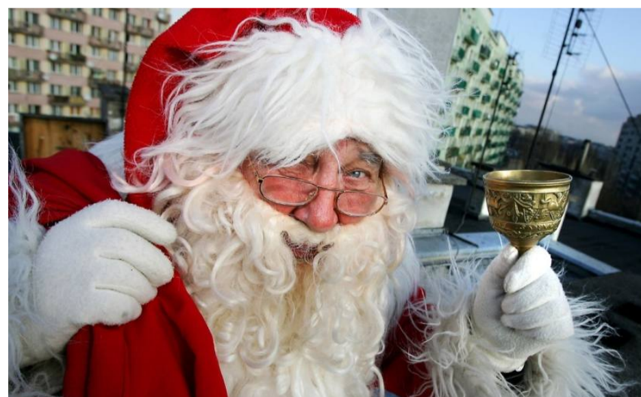
Każdy może pomóc

W najbliższy poniedziałek 20 listopada członkowie szkolnego klubu wolontariusza zorganizują sprzedaż ciast, a 27 listopada loterię zabawek. Do 24 listopada wolontariusze będą zbierać zabawki przeznaczone na loterię. Każdy uczeń, który odda swoje niepotrzebne zabawki otrzyma pochwałę.