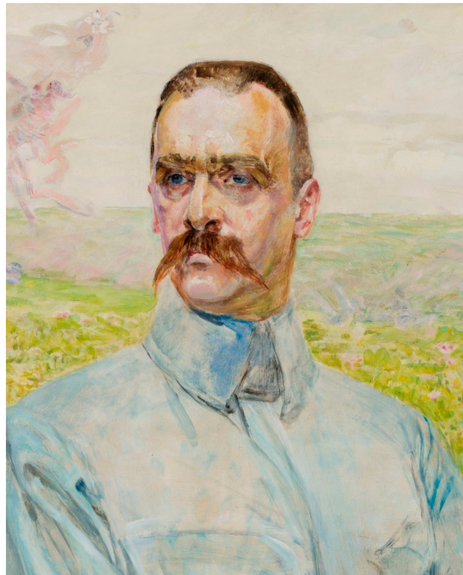
Portret brygadiera Józefa Piłsudskiego