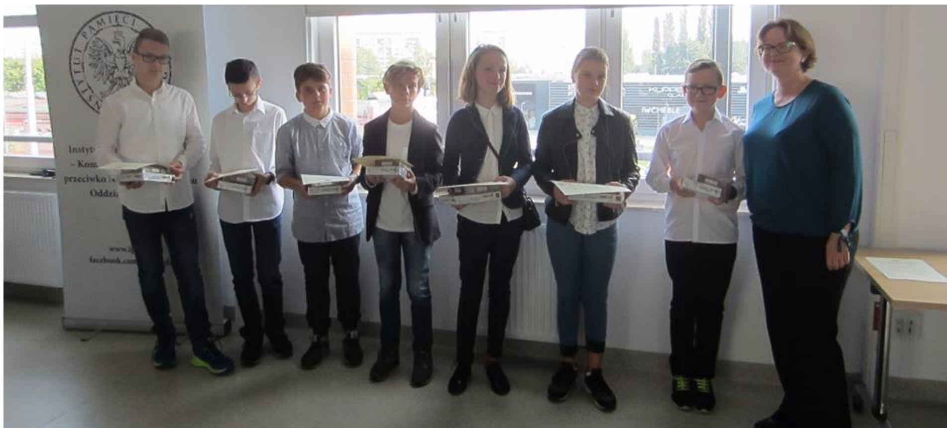
Instytut Pamięci Narodowej Oddział w Gdańsku - wręczenie nagród