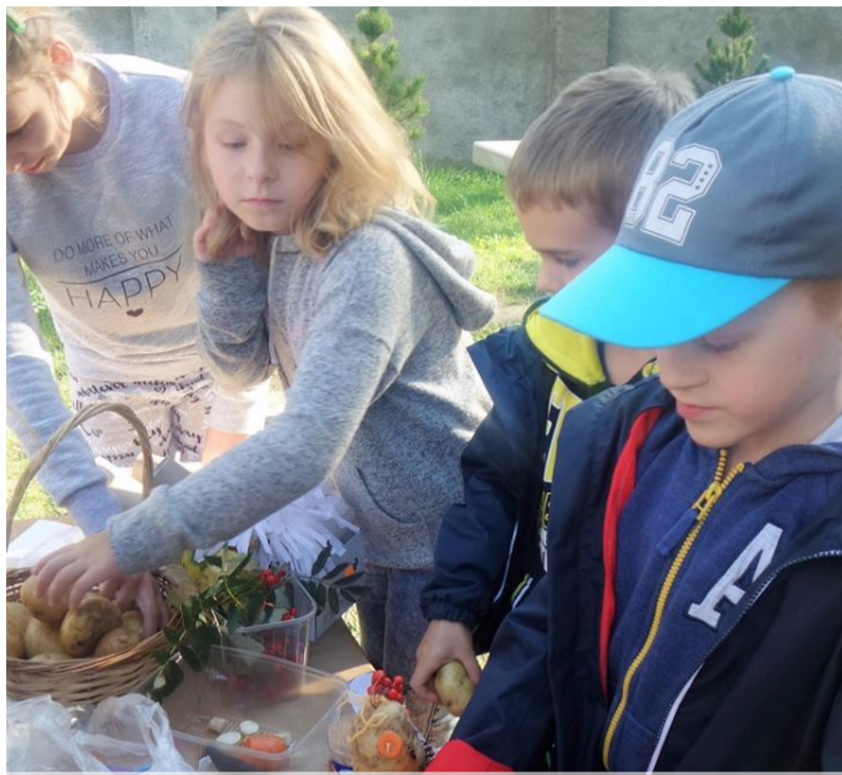
Pożegnanie lata z ziemniakiem