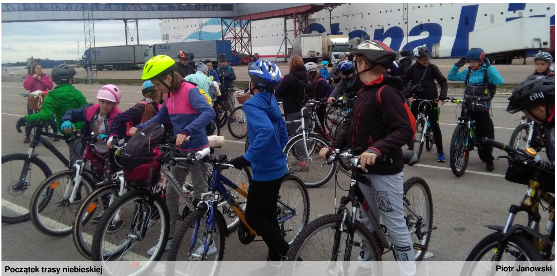
Początek trasy niebieskiej