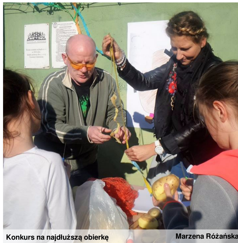
Konkurs na najdłuższą obierkę